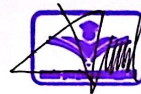
Andika Direktur mutu-perguruantinggi.id