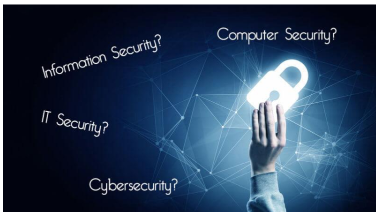
Gambar 12. 1 Kemanan Informasi

Keamanan informasi sudah menjadi prioritas utama dalam organisasi modern (Whitman dan Mattord, 2014). Lange, Solms dan Gerber (2016) berpendapat bahwa keamanan informasi merupakan komponen yang krusial dalam mencapai kesuksesan organisasi, terlepas dari bidang atau fungsi organisasi tersebut. Pendapat tersebut didasari pemikiran sebagaimana yang dikemukakan Kovavich (2006) dalam Lange dkk (2016), bahwa informasi merupakan salah satu aset yang paling penting dari tiga aset berharga yaitu: people, physical property and information.