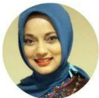
Dr. MARISSA HAQUE SPEAKER

Tema : Pemberdayaan dan Pengembangan Potensi Ekonomi Ibu-Ibu WNI Mix Marriages