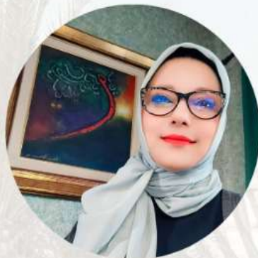
Dr. Marissa Grace Haque, S.H., M.Hum., M.B.A., M.H., M.Si