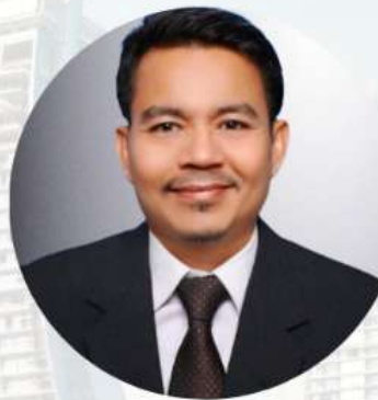
Dr. Sparta, SE., Ak., ME., CA.